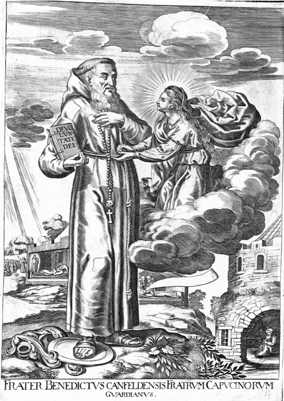
Gravure 1 – Benoît de Canfield, Gravure de Loeffler, Flores Seraphici , Bibliothèque Centrale des Capucins de Rome, 172 F 1